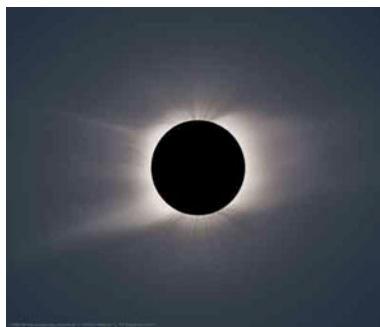
Figura 2. La corona solar así como prominencias que se observan en la superficie del Sol.

La estrella que se ha observado con mayor resolución, la cual creemos conocer bien, es una cercana, llamada Sol. Fue sólo después de entender la radioactividad, a principio del siglo XX, cuando se pudo entender cuál era la fuente de energía última del Sol. Uno de los enigmas del Sol que más ha perturbado, aparte del problema de los neutrinos solares, ha sido el de explicar el mecanismo por el cual la corona del Sol (ver figura 2) presenta una temperatura tan alta (del orden del millón de grados) siendo que en su superficie la temperatura apenas llega a los 6,000 K.