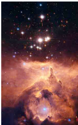
Figura 3. El cúmulo abierto Pismis 24, en él habita una estrella que tiene aproximadamente 200 veces la masa del Sol, todo un récord. Esta estrella se localiza por arriba del gas, siendo la más brillante.

El avance realizado en el entendimiento y modelaje de los interiores estelares ha sido enorme en los últimos 20 años. Se puede decir que el grado de comprensión sobre qué procesos concurren dentro de una estrella es muy bueno. Sin embargo, existen todavía fases de las estrellas que no se entienden. Uno de los temas de mayor actividad actualmente es el de determinar, desde un punto observacional, cómo se forman las estrellas masivas. Esto es, las estrellas con una masa mayor a 8 veces la masa del Sol. En la visión convencional que tenemos de la formación de las estrellas, la fuerza de la gravedad atrae material y lo condensa formando una nube de gas. La gravedad también tiende a fragmentar a la nube en pequeñas partes, lo cual conduce a la formación de un cúmulo de estrellas. Dicha fragmentación puede inhibir la formación de estrellas masivas, puesto que las estrellas que se forman calientan y evaporan el gas de la nube. Curiosamente se ha visto que las estrellas más masivas suelen nacer en cúmulos de estrellas (Larson 2009) y son pocas las que nacen aisladas (ver figura 3).