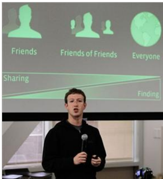
Mark Zuckerberg, CEO y fundador de Facebook. La red social cuenta con un límite por perfil que algunos usuarios buscan alcanzar, a pesar de las restricciones

su "estado" para desconocidos, antiguos colegas y compañeros de colonia de verano de hace 300 años.